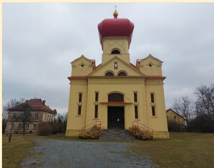
Chrám sv. Cyrila a Metoděje v Chudobíně. Vlevo farní budova.