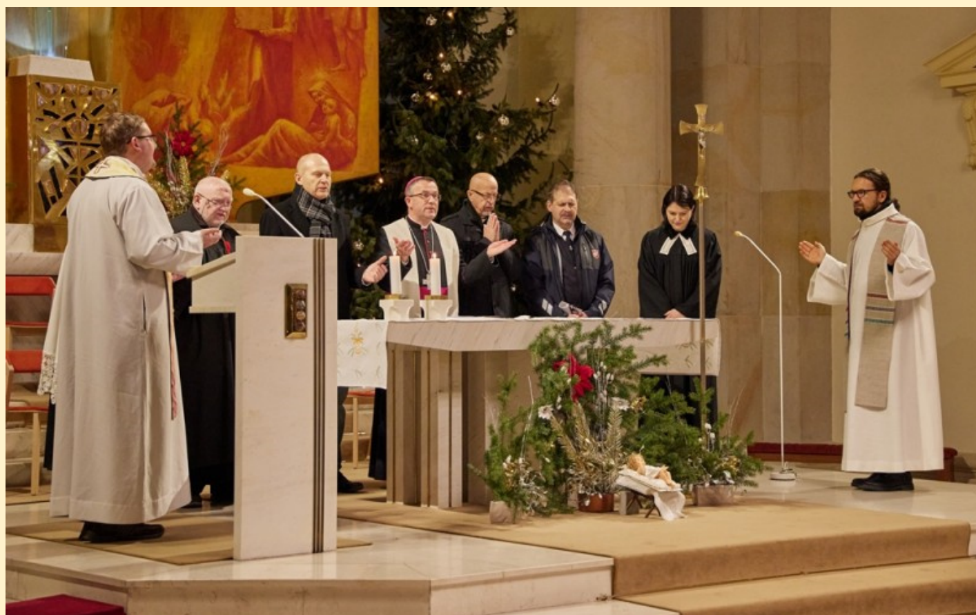
Ekumenická bohoslužba v ostravské katedrále Božského Spasitele, leden 2023.