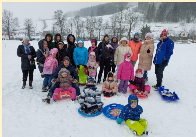
Pampeliška – adaptační skupina pro ukrajinské děti. Náboženská obec Církve československé husitské Olomouc ve spolupráci se Základní školou svaté Voršily.