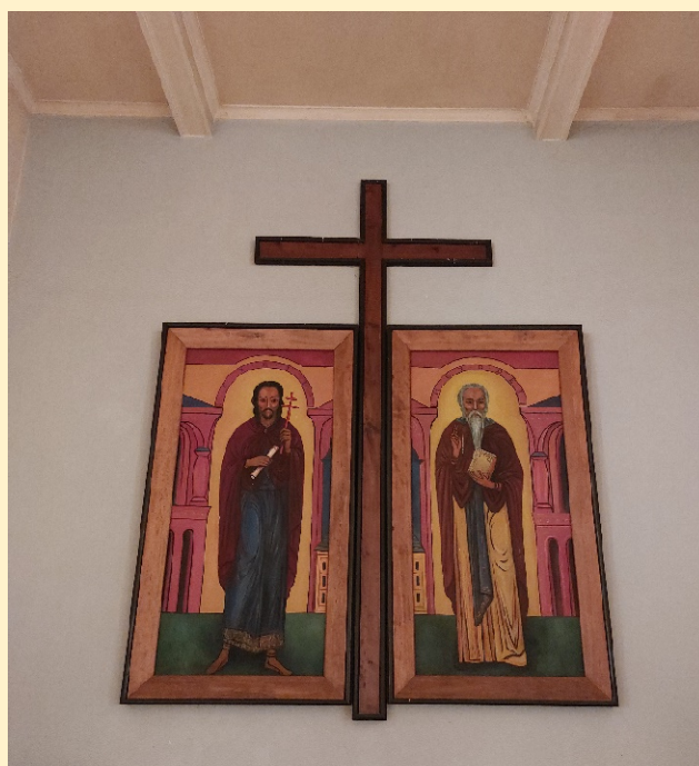
Oltářní obraz v chrámu sv. Cyrila a Metoděje v Chudobíně.