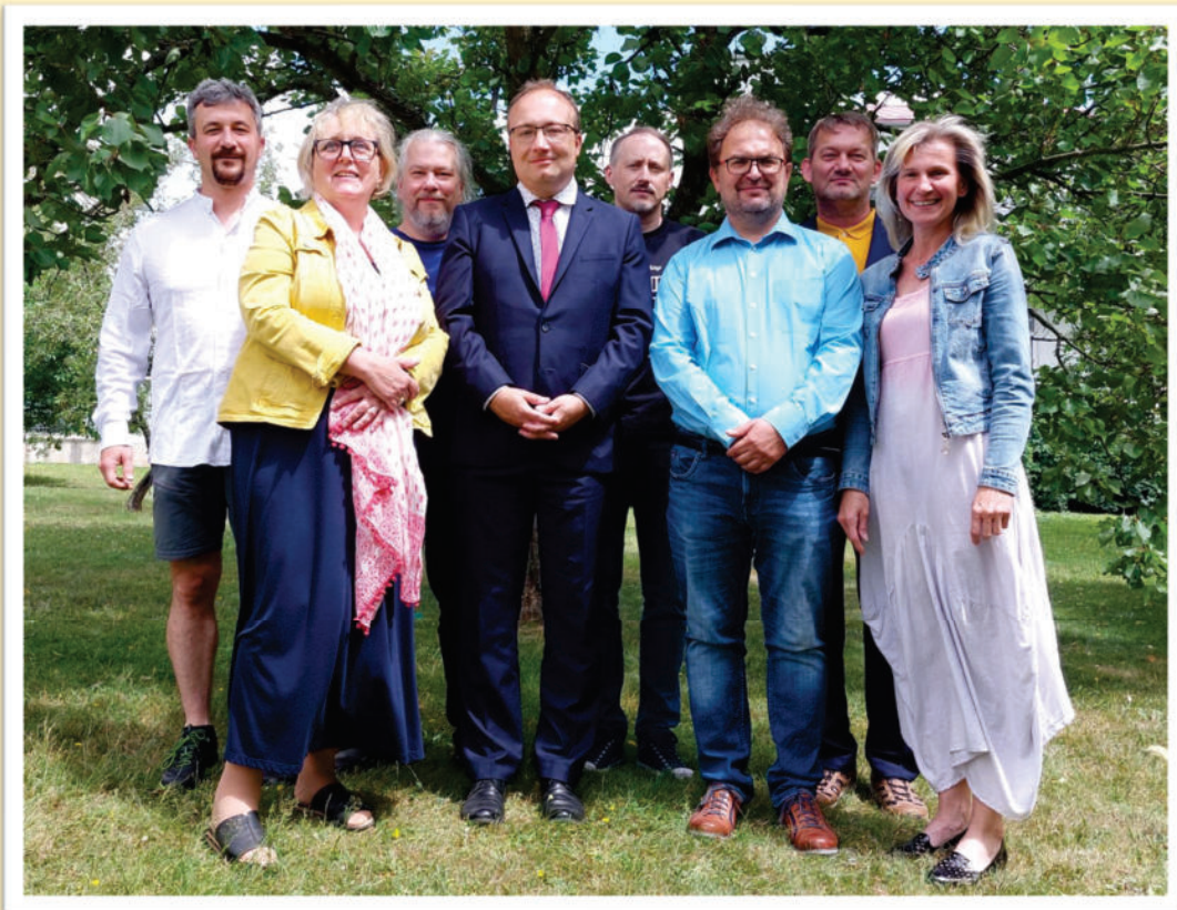
Nová diecézní rada