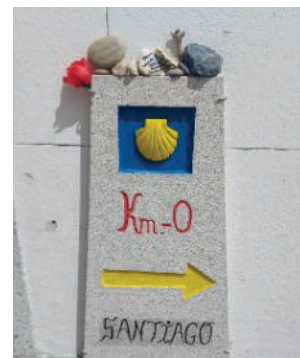
A to je konec. Už jen dojít si pro potvrzení.