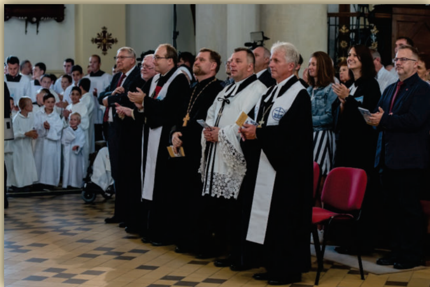
Ekumenická delegace v ostravské katedrále na slavnosti uvedení nového římskokatolického biskupa