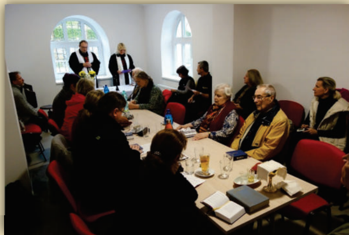
Bohoslužba v církevním středisku v Jeseníku