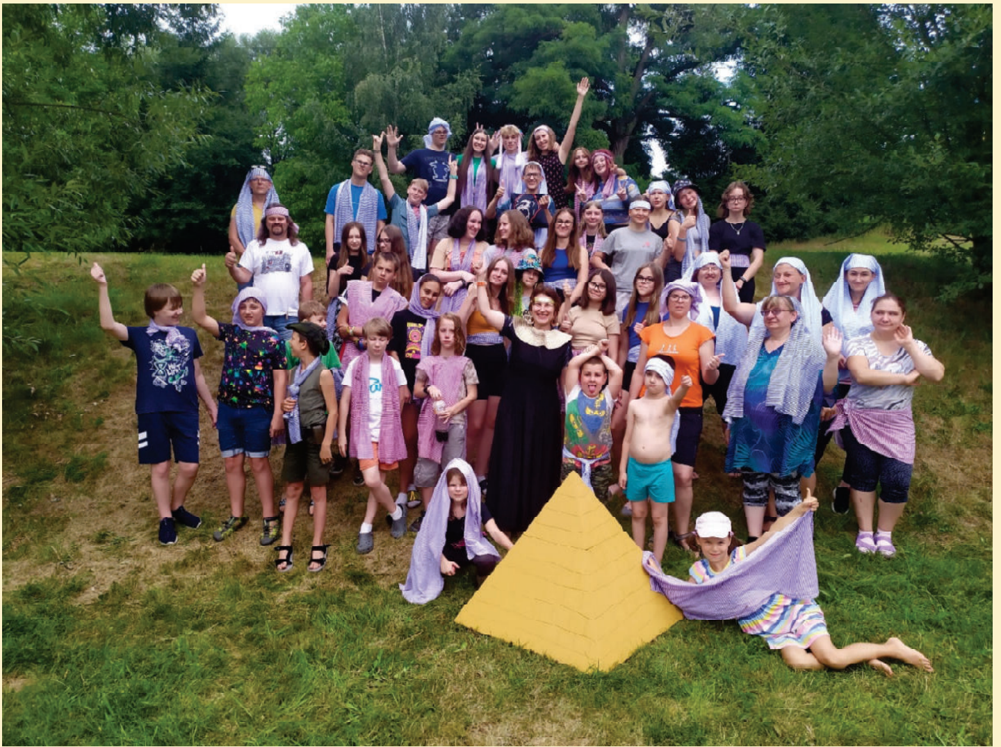
Účastníci hry o příběhu Josefa a jeho bratrů na křesťanském táboře Archa