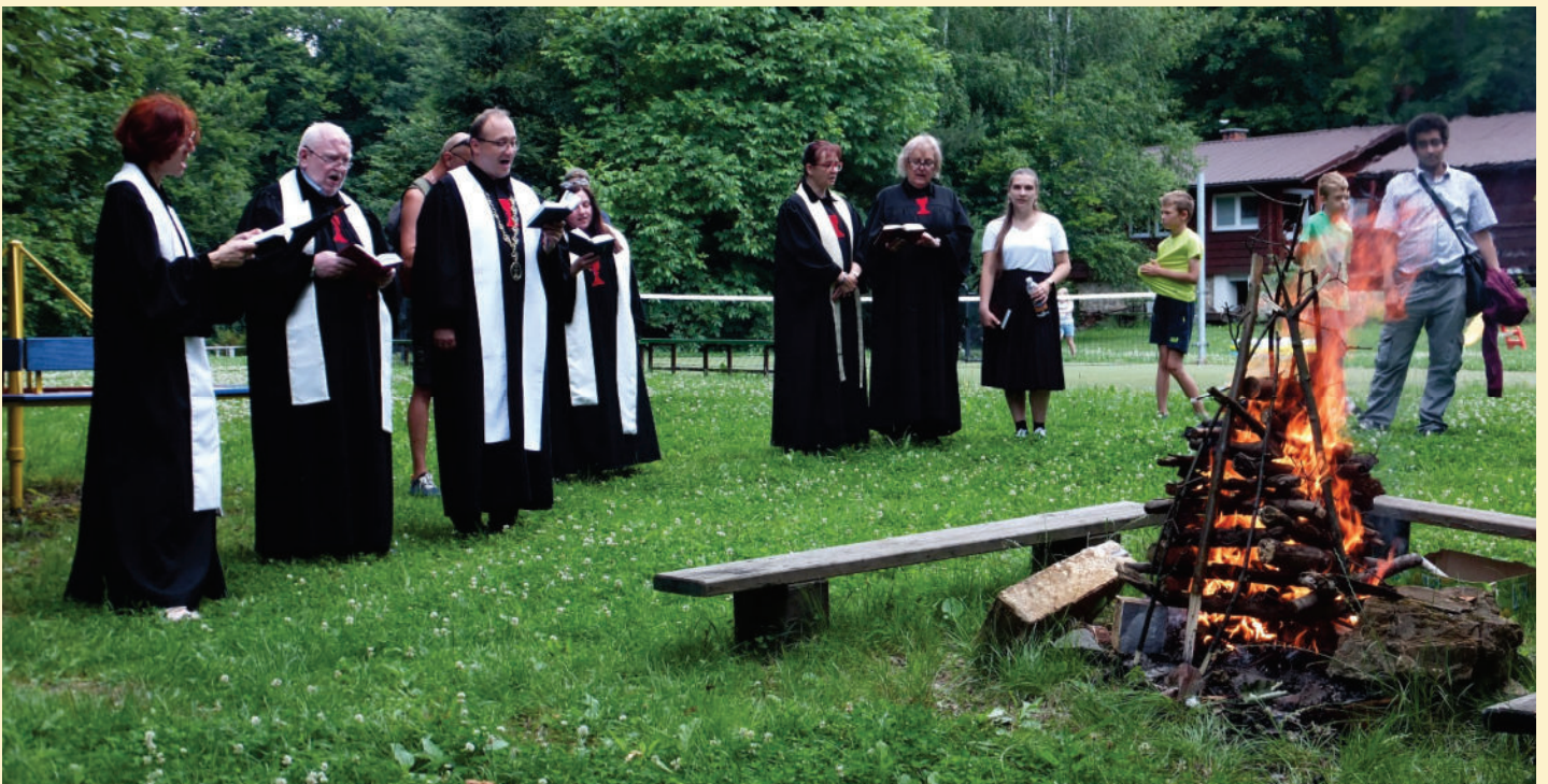
Z husovské pouti na Ostravici