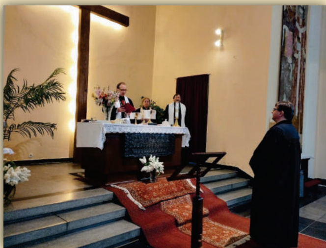
Jáhenské svěcení v Ostravě – Svinově