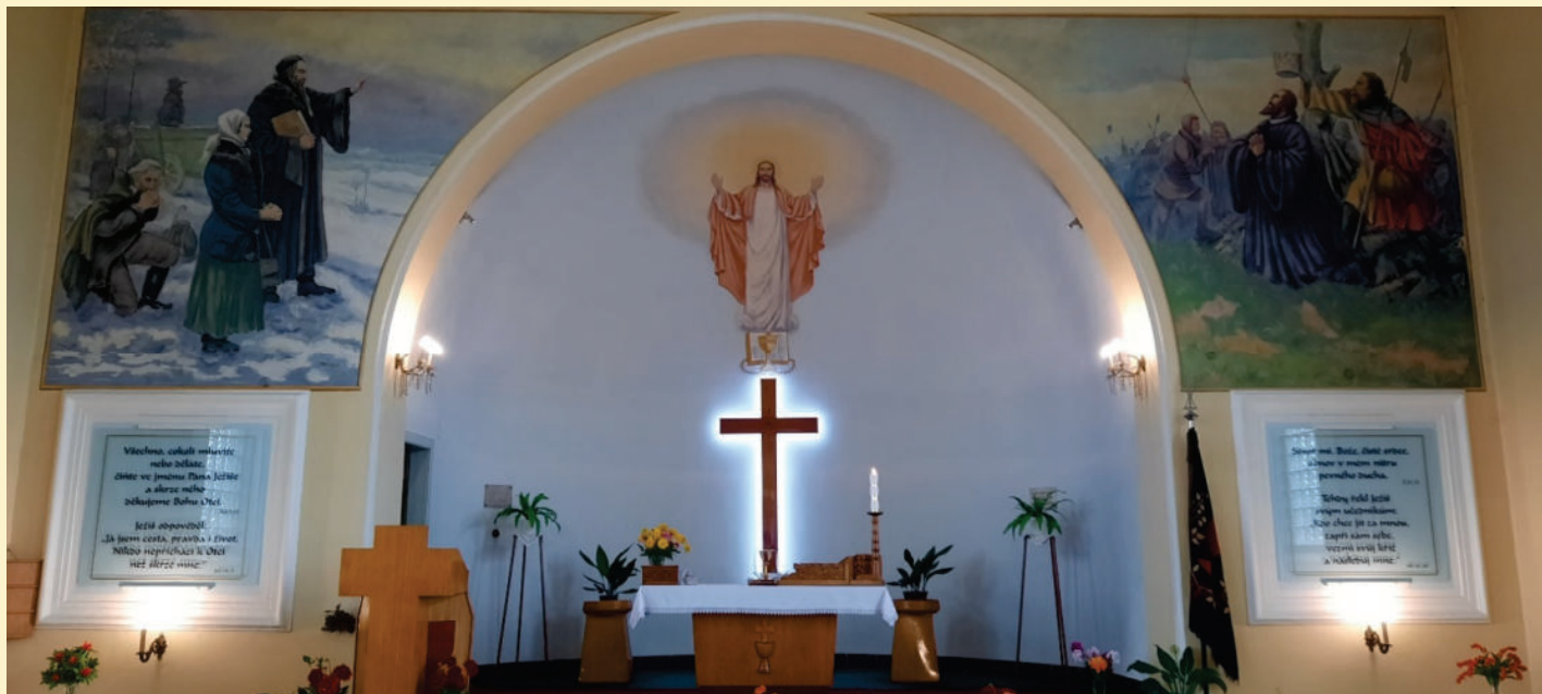
Interiér Husova sboru v Ostravě – Polance